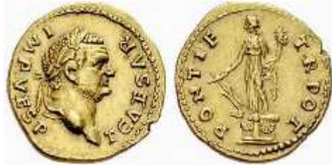
სურ.3. ვესპასიანეს (69-79 წწ.) აურელსი (74 წ.)