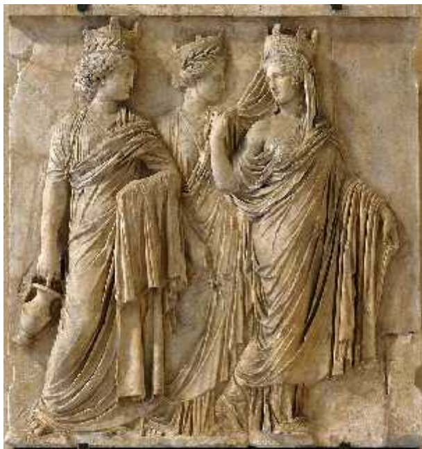
სურ. 9. სამი ტიხეს გამოსახულება ლუვრის მუზეუმიდან (ახ.წ. 160 წ.)