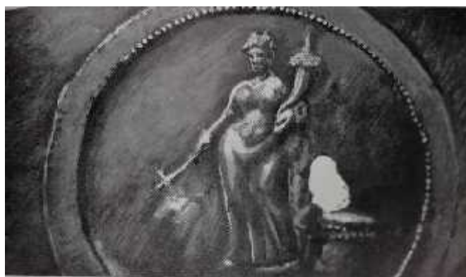
სურ.12. ტიხე-ფორტუნას გამოსახულება ვერცხლის ლანგრის ძირზე მოთავსებული მედალიონიდან (ახ.წ. II ს-ის ბოლო-III ს-ის დასაწყისი) (ციხისძირის განძი)