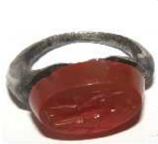
სურ. 14. სარდიონის ინტალიო ტიხე-ფორტუნას გამოსახულებით ვერცხლის ბეჭედში. სამთავროს სამაროვანი №605 სამარხი (ახ.წ. III ს.)