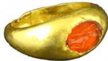
სურ. 15. სარდიონის ინტალიო ტიხე-ფორტუნას გამოსახულებით ოქროს ბეჭედში. სვეტიცხოველი IV, №6 სამარხი (ახ.წ. II ს.)