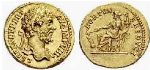
სურ.5. სეპტიმიუს სევერუსის აურელსი 196-197 წწ.