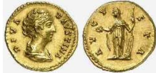
სურ.4. ანტონინუს პიუსის (138-161 წწ.) აურელსი. ფაუსტინა უმცროსისა და ფორტუნას გამოსახულებით (141 წ.)