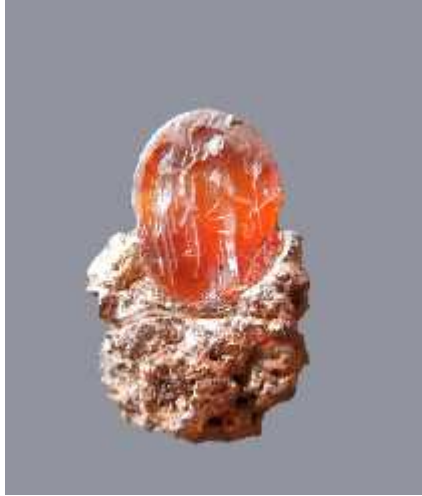
სურ.16. რიხე-ფორტუნა-დემეტრას გამოსახულებიანი სარდიონის ინტალიო რკინის ბეჭედში სვეტიცხოვლის უბანი №46 სამარხი (ახ.წ.III ს.)