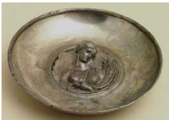
სურ. 11. ტიხე-ფორტუნას გამოსახულება ვერცხლის ფიალის ფსკერზე (ახ.წ. II ს.) (არმაზისხევი №6 სამარხი)