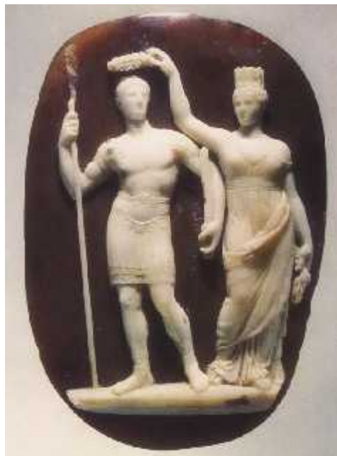
სურ. 10. კონსტანტინოპოლის ტიხე (ახ.წ. IV ს-ის 30-იანი წლები) სახელმწიფო ერმიტაჟიდან