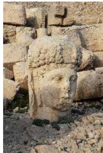
სურ.9. ტიხეს თავის ქანდაკება ნემრუთ-დალიდან