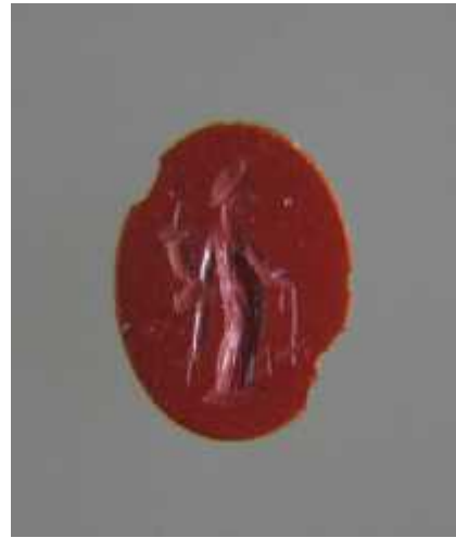
სურ. 17. ტიხე-ფორტუნას გამოსახულებიანი ნარინჯისფერი ტოპაზის ინტალიო გონიო-აფსაროსიდან (ახ.წ. II-III სს.)