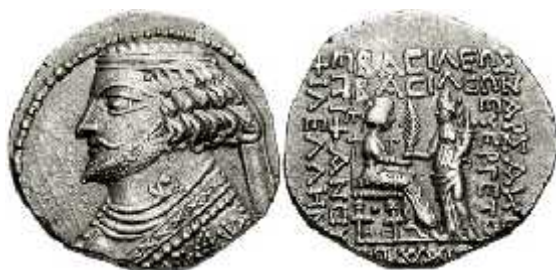
სურ. 8. ფრაატ IV (არშაკიდების დინასტია, ძვ.წ. 37-2 წწ.) ვერცხლის მონეტა